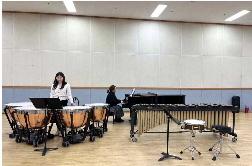
3. 팀파니(2분 이내)