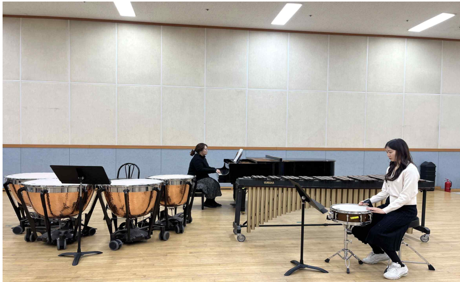
1. 스네어 드럼(2분 이내)