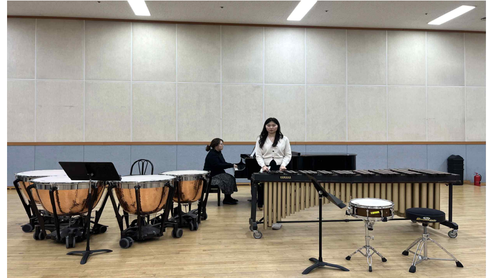
2. 마림바(4분 이내)